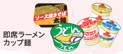
即席ラーメン カップ麺