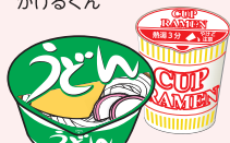
即席ラーメン カップ麺