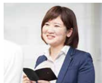
沓谷支店 資産運用サポーター

先日、30歳代の会社員の方より、資産運用の相談を受け、少額から非課税で投資できるNISA制度を利用し、預金と併用しながらの資産形成のご提案をいたしました。数日後、投信積立の契約をしていただき、「今後のマネープランを考える良いきっかけになった。」とのお礼のお言葉をいただきました。低金利が続く中、金融資産をどのように運用していくかは多くのお客さまが興味を持っていらっしゃると思います。このようなお客さまに対し、身近な相談相手として、ニーズに合ったご提案をしていきたいと思っております。