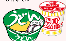
即席ラーメン カップ麺