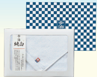
◆ 今治フェイスタオル

◆ 定期預金のご契約につきましては、新規お預け入れまたは、増額での書替が対象となります。◆ プレゼント品は数に限りがありますので、予めご了承願います。◆ 写真はすべてイメージです。