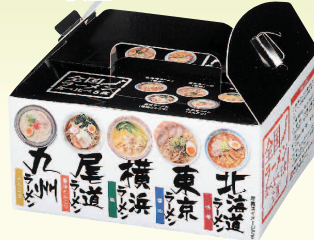
◆ 全国ラーメン食べ比べ5食入り