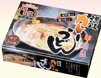
◆ 讃岐カレーうどん